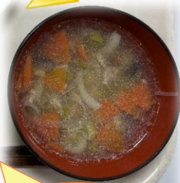
岩手県の ひつまみ汁