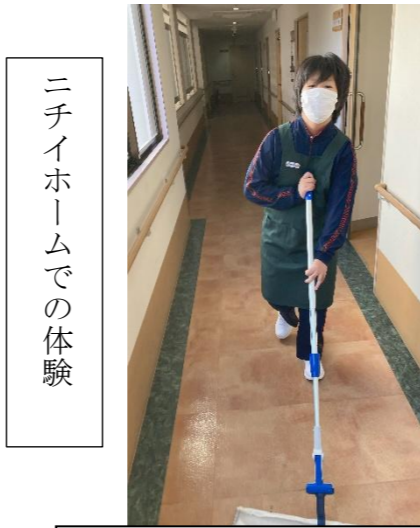
ダスタークロス掛け体験