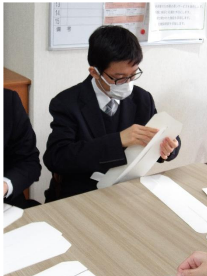
立川福祉作業所での体験

実際の職場での作業は、学校での練習以上に緊張感や意欲をもって頑張れた生徒が多かったと思います。貴重な経験を将来に生かしてほしいです。