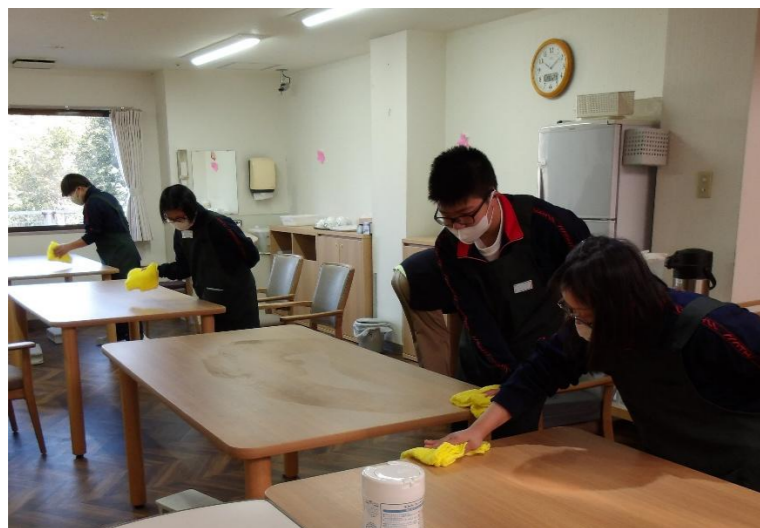
テーブル拭き体験